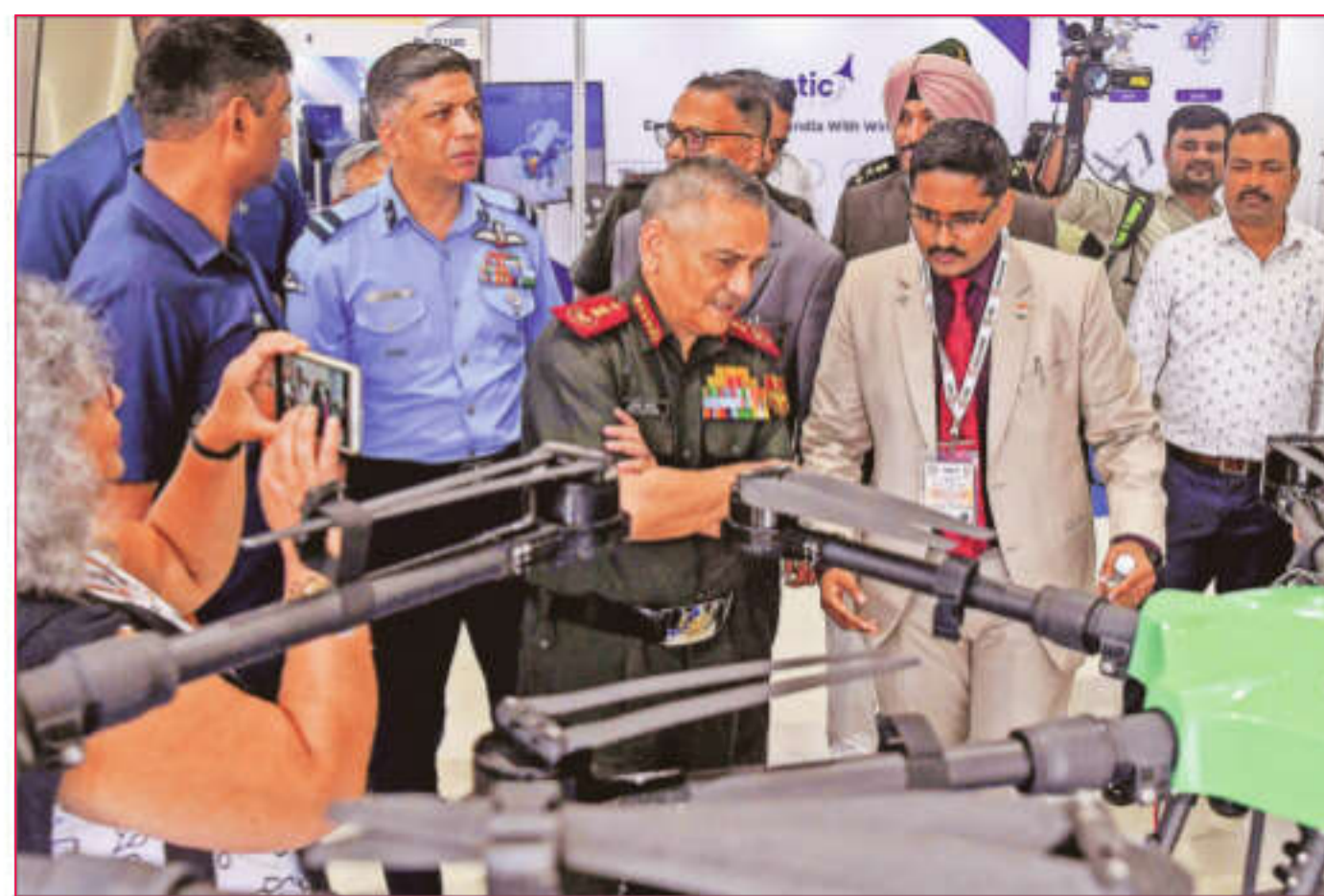
Chief of Defence Staff General Anil Chauhan visits the exhibition on indigenisation of critical components currently being imported from foreign OEMs in the areas of UAV & C-UAS, at the Manekshaw Centre, in New Delhi on Wednesday