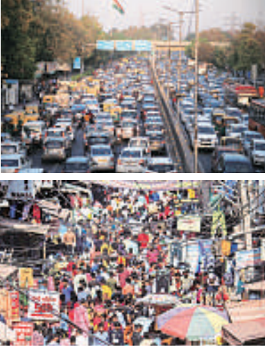
हुआ कि लोग बिना डर के बाजारों में खरीदारी करने के लिए आए।

भीड़ को देखकर मानों ऐसा लग रहा था कि कोरोना का संकट अब टल चुका है। पूर्वी दिल्ली के लक्ष्मी नगर, कल्याणपुरी के अलावा न्यू कॉडली इलाके में भी लोगों को बाजारों में खरीदारी करते हुए देखा गया। मयूर विहार फेस एक स्थित सत्या निकेतन में पुलिस ने मार्ग को वन-वे कर दिया था, ताकि खरीदारी करने आने वाले लोगों को दिक्कतों का सामना नहीं करना पड़े, लेकिन यहां भी लोग जाम में फंसे दिखे। शाम के वक्त बाजारों में और अधिक रोकन बढ़ गई। दुकानदारों ने भी बताया कि कोरोना काल के पहली बार ऐसा