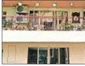
On February 10, a portion of the sixth floor of Chintels Paradiso had collapsed

CBI sources said that based on information that the professor