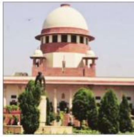
Apex court says there is no constitutional infirmity in central government's 2015 decision

A bench led by Justice DY Chandrachud, however, directed the Union government to carry out a re-fixation exercise from July 1, 2019 as per the terms of the communication of 2015, since it was to be done every five years and could not be undertaken possibly because of the present proceedings.